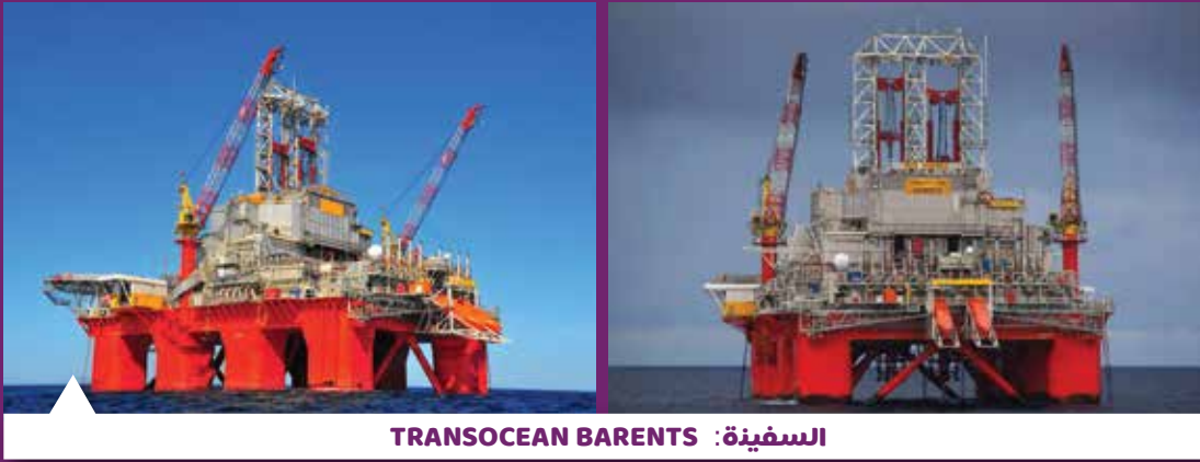
السفينة: TRANSOCEAN BARENTS